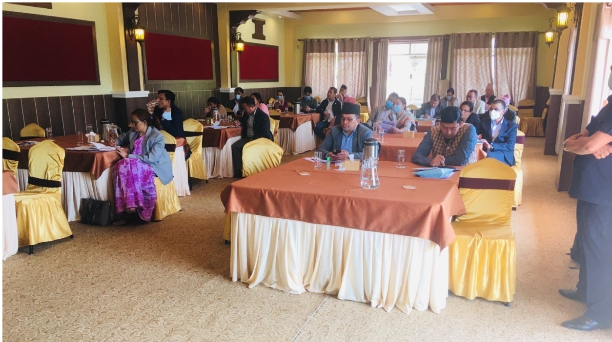
सहभागी मा. सदस्यहरु, सार्वजनिक लेखा समिति